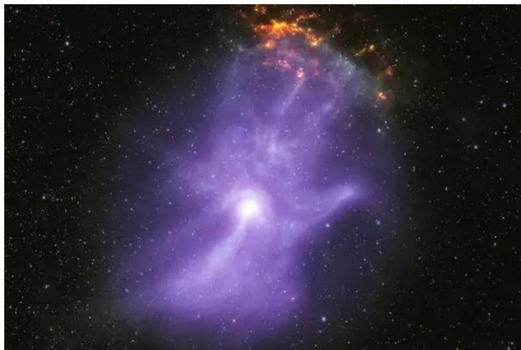
ידו של האל

כלומר, לבריאה כולה יש יד מכוונת הפועלת מבעד לתוכניות קוסמיות מוגדרות . חשוב להבין לעומק את המשמעות של תוכנית – מוגדרת: הכל צפוי והרשות נתונה (מסכת אבות ג', ט"ו). יש יד מכוונת.